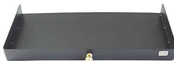
Pomello in ottone