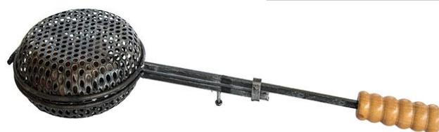
Poignée en bois